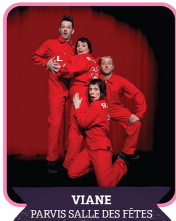
VIANE PARVIS SALLE DES FÊTES