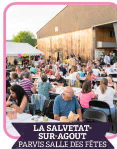
LA SALVETAT- SUR-AGOUT PARVIS SALLE DES FÊTES

Deux hommes se rencontrent autour d'un conteneur. Ils ne parlent pas la même langue mais apprennent à communiquer. Entre rythme, musique et mouvement, leur relation évolue. Un spectacle sur la rencontre et le vivre ensemble.