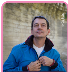
GIJOUNET LE BUFFET DE LA GARE

En partenariat avec Los Passejaires. Réservation conseillée : coordination@arpegesettremolos.net