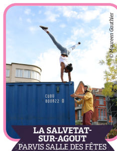
LA SALVETAT- SUR-AGOUT PARVIS SALLE DES FÊTES

Ce spectacle mêle humour, poésie et réflexion. À travers un personnage sensible, il aborde des sujets de société avec des jeux de langage. Une mise en scène simple laisse toute la place aux mots. Un moment à la fois accessible et profond.