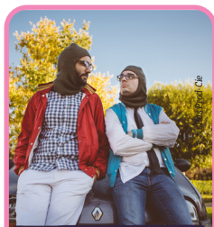
ESPÉRAUSSES PARVIS SALLE DES FÊTES