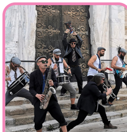
LACAUNE CHEZ OBERTTI