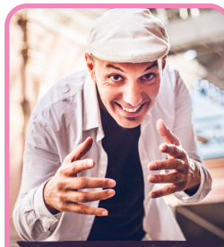
LACAUNE PLACE DE L'ÉGLISE

La Fanfare des Goulamas débarque au festival Marée Haute avec son énergie communicative. Composée de 7 musiciens, elle propose un répertoire festif et rythmé. Cuivres, percussions et bonne humeur pour des interventions joyeuses et pleines de surprises.