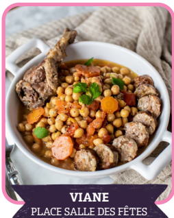
VIANE PLACE SALLE DES FÊTES

La Clique propose un spectacle improvisé et interactif. À partir des idées du public, les artistes créent des scènes uniques. Chaque représentation est différente. Un moment participatif, drôle et accessible à tous.