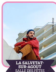
LA SALVETAT- SUR-AGOUT SALLE DES FÊTES

Le Schmilblick Club transforme la place en piste de danse avec son manège musical participatif. Le public est invité à bouger et à jouer. Un moment ludique, accessible à tous, pour une expérience collective et joyeuse.